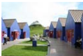
Vikingabyn vid Borge