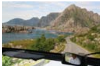
På väg runt Lofoten