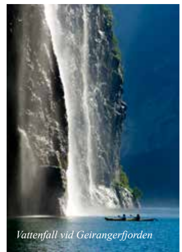
Vattenfall vid Geirangerfjorden