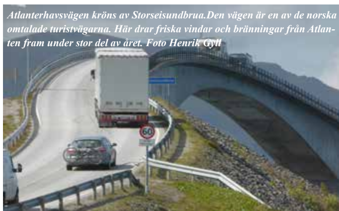
Atlantehavsvägen kröns av Storseisundbrua. Den vägen är en av de norska omtalade turistvägarna. Här drar friska vindar och bränningar från Atlanten fram under stor del av året.