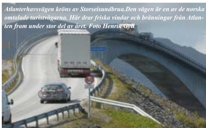
Atlantehavsvägen kröns av Storseisundbrua. Den vägen är en av de norska omtalade turistvägarna. Här drar friska vindar och bränningar från Atlanten fram under stor del av året.